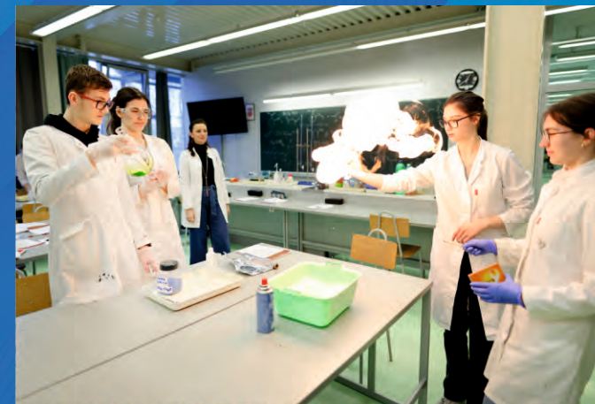
Centri izvrsnosti u Koprivnici, Križevcima i Đurđevcu

Centrom kompetentnosti u Koprivničko-križevačkoj županiji dograđene su i opremljene Obrtnička škola Koprivnica i Strukovna škola Đurđevac. Ukupna vrijednost I. i II. faze projekta iznosi 10 milijuna eura.