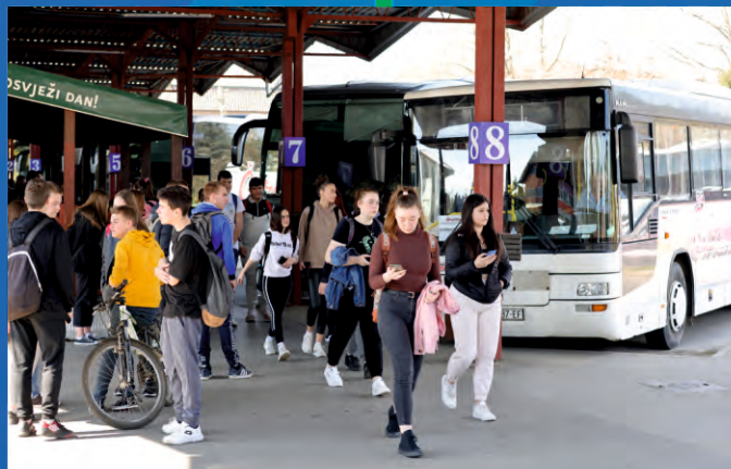
Prijevoz učenika srednjih škola