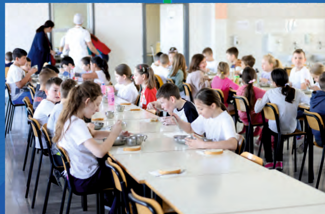
Pametan obrok za pametnu djecu