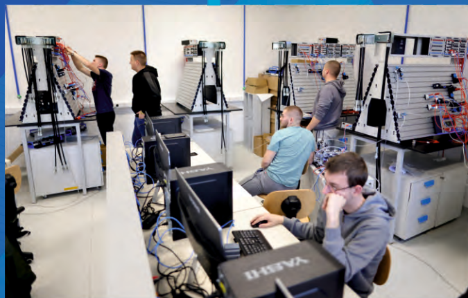
Nova oprema u Centru kompetentnosti u Đurđevcu

Koprivničko-križevačka županija kontinuirano kreira i prati projekte kojima potiče izvrsnost učenika, brine o najugroženijim skupinama, razvija specifične vještine i znanja.