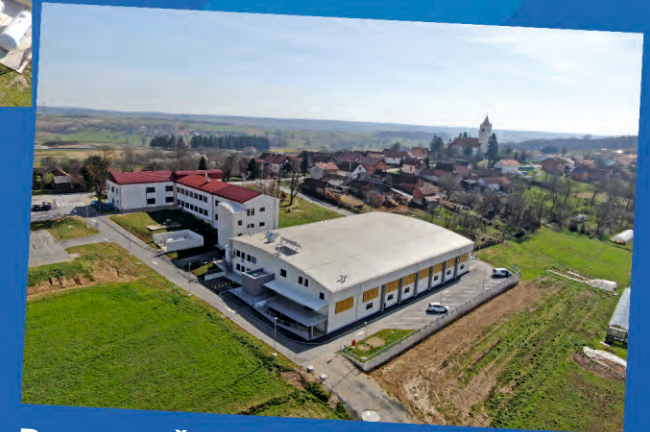
Dvorana OŠ Sveti Petar Orehovec