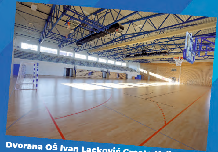
Dvorana OŠ Ivan Lacković Croata Kalinovac

Izgrađene i opremljene sportske dvorane škole koriste za izvođenje nastave i ostale sportske aktivnosti, a stanovnici navedenih općina za sportska i ostala društvena događanja.