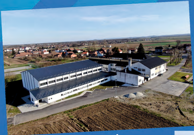
Dvorana OŠ Kloštar Podravski

Značajno je poboljšanje sportske i školske infrastrukture u pet općina ulaganjima od 10,6 milijuna eura.