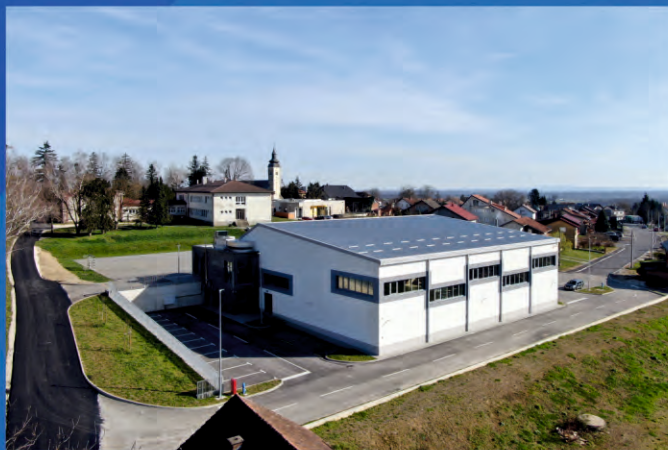
Dvorana OŠ „Grigor Vitez“ Sveti Ivan Žabno

Općine: Kalinovac, Kloštar Podravski, Rasinja, Sveti Ivan Žabno i Sveti Petar Orehovec.