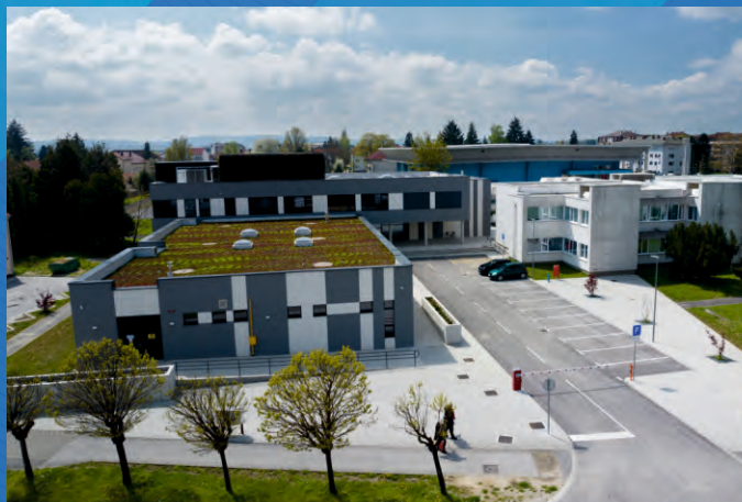
Centra kompetentnosti u Koprivnici