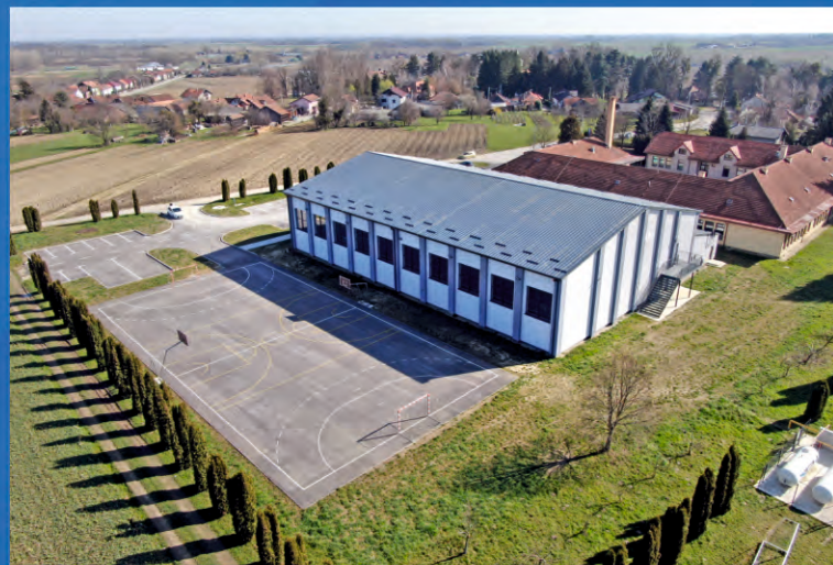
Dvorana OŠ Andrije Palmovića Rasinja

Značajno je poboljšanje sportske i školske infrastrukture u pet općina ulaganjima od 10,6 milijuna eura.